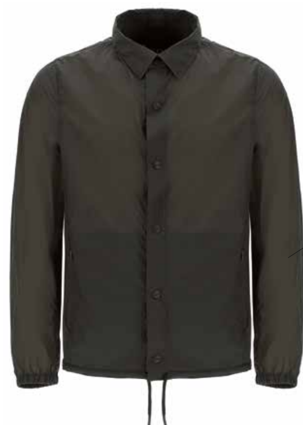
Giacca-camicia in nylon ultraleggero anti-pioggia opaco, chiusa da press button gommati e coulisse sul fondo regolabili. hernio.it