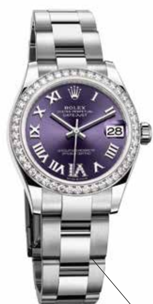
Rolex Oyster Perpetual Datejust 31 in Rolesor bianco con quadrante aubergine con diamanti e bracciale Oyster. rolex.com