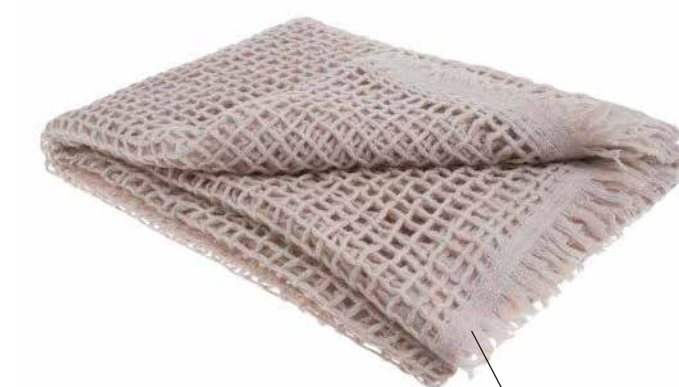
Machiavelli Plaid 'a rete' in alpaca. cm 140x200 realizzato a mano da S.Patrignano Lab per C&C Milano cec-milano.it