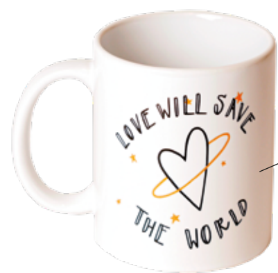
Tazza Love Therapy realizzata in porcellana con un messaggio d'amore "Love will save the world" lovetherapy.it