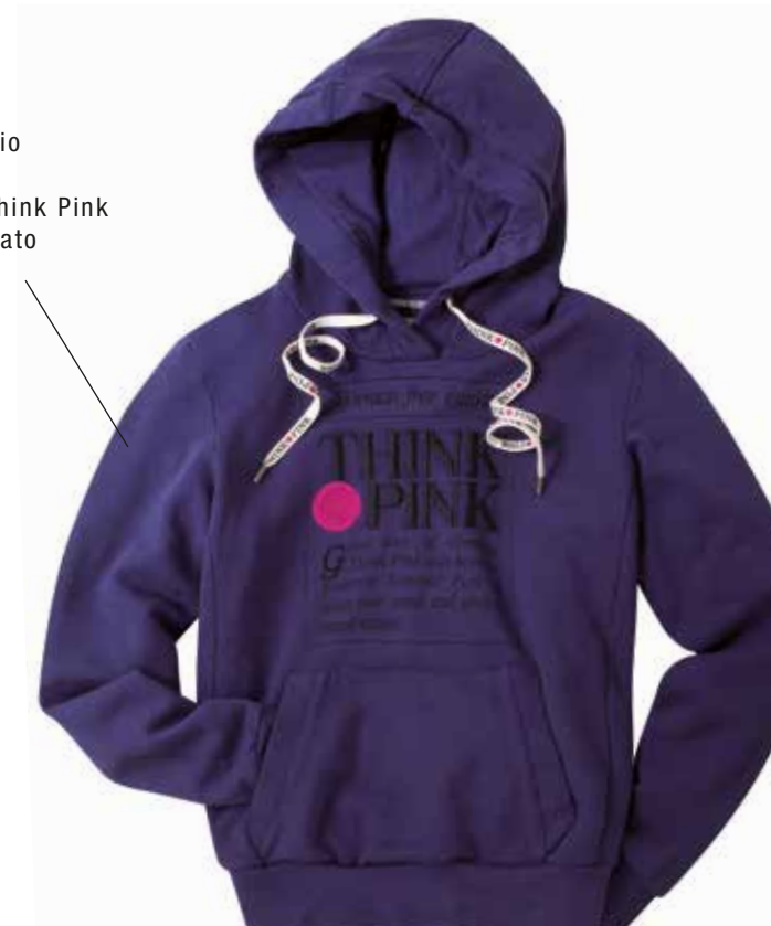
Felpa con cappuccio in 100% cotone con stampa logo Think Pink istituzionale ricamato e stampato. thinkpink.it