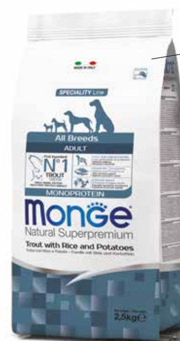
All Breeds Adult Monoprotein Trota con Riso e Patate Formato: 2,5 kg - 12 kg Monge Natural Superpremium All breeds Adult Monoprotein* trota con riso e patate è un alimento completo per cani adulti di tutte le taglie. Specificamente sviluppato pensando al benessere del tuo cane, grazie alla presenza di sostanze nutritive di qualità frutto della ricerca Made in Italy. monge.it