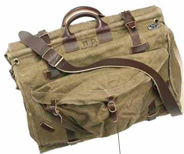
Recuperate dagli equipaggiamenti dell'Esercito italiano. Alcune raccontano la loro storia con piccoli segni di usura, su alcune è possibile ritrovare le iniziali del soldato che l'aveva in dotazione o, ancora, il nome della sua amata nascosto all'interno di una tasca. Ogni borsa è in tela, ed è rifinita a mano in cuoio testa di moro: con i suoi due scomparti interni e la grande tasca esterna. Misure 53x32cm 2010le.com