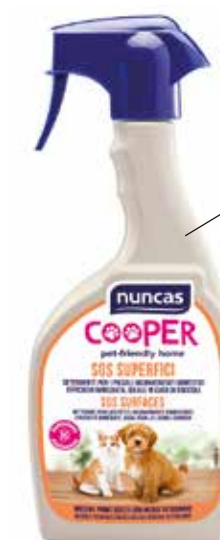
SOS Superfici Cooper deterge tutte le superfici e oggetti che entrano in contatto con gli animali (mobili, ripiani, pavimenti). È studiato apposta per rimediare ai piccoli "incidenti domestici", per questo è ideale in caso di cuccioli. Perfetto per lettiere, gabbie, cucce, trasportini, giochi e ciotole. Il mix esclusivo di estratti naturali elimina efficacemente gli odori. nuncas.it