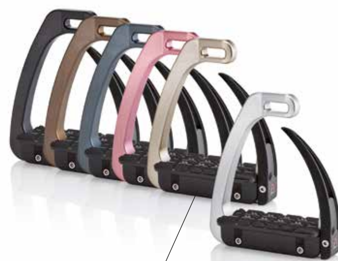
Staffa Safe Riding S-Light S-Light è la nuova staffa creata per unire sicurezza totale, comfort e robustezza in soli 480 grammi di peso. saferiding.it