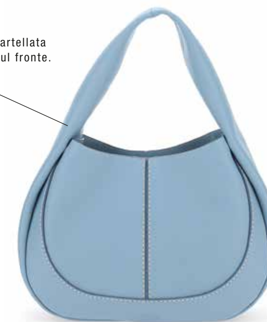
Shirt Bag Tod's in pelle martellata con logo Tod's impresso sul fronte. tod's.com