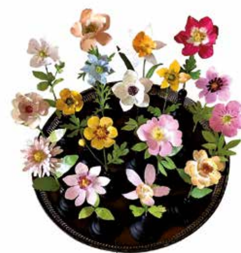
L'Erbavoglio è un piccolo atelier nel cuore di Brera. Le piante e i fiori sono realizzati partendo da una lastra di rame che viene tagliata e dipinta rigorosamente a mano. Instagram erbavoglio_milano erbavoglio.art